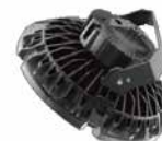
Accesorio Superficie Pared